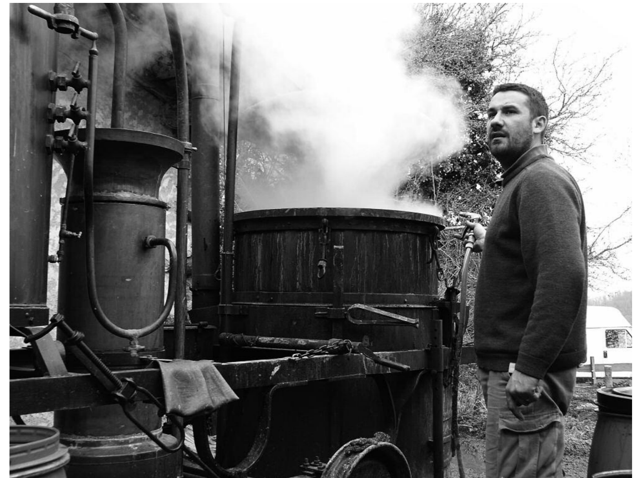
à l'alambic en montagne à la fin de l'hiver