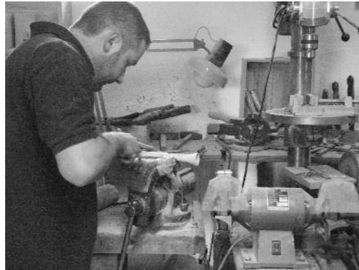
Finition d'un clarinet

entre les deux côtés des Pyrénées : la gaita de boto m'attire énormément (c'est la cornemuse aragonaise), je suis en train de l'explorer sous tous ses aspects pour pouvoir en fabriquer, ainsi que le sac de gemecs (cornemuse catalane). Je sens qu'une spécialisation sur les cornemuses pyrénéennes m'attend... Je vais à Boltaña régulièrement, c'est une extraordinaire rencontre de luthiers en Aragon. Je prétends qu'il y a un avenir au moins aussi fort à relier les deux versants des Pyrénées que d'essayer d'unifier cette grande Occitanie ! Les points communs entre ces cultures (aragonaise et catalane, et de l'autre côté gasconne et languedocienne) m'apparaissent de plus en plus évidents, ne serait-ce que dans l'ethnographie et dans l'organologie... On peut aussi parler des « cornemuses imaginaires » : le bot du Val d'Aran et la samphona , cornemuse polyphonique des Pyrénées, dont